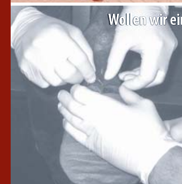
Wollen wir ein