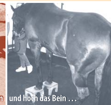
und hoch das Bein ...